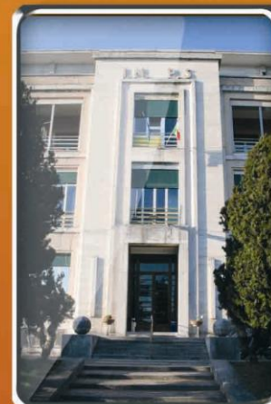
P.O. "Giovanni da Procida" Salerno

OGGI IL NOSTRO INVESTIMENTO E' NELLA CURA E NELLA RICERCA