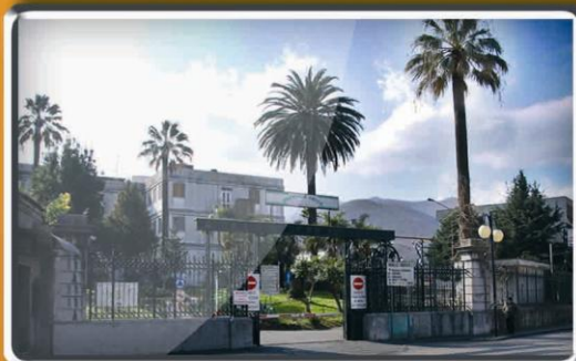
P.O. "Ospedale Amico" Gaetano Fucito Mercato San Severino