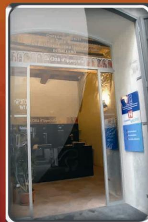
Punto Accoglienza "L'Ospedale Vicino" via Mercanti 63 - Salerno